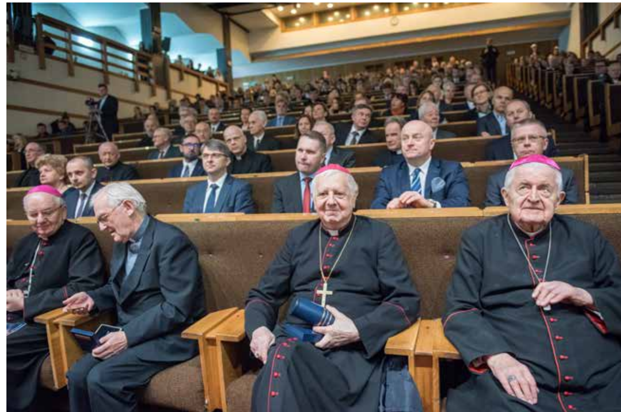
Niezmienna dewiza „Deo et Patriae” – zapewniał Rektor KUL zgromadzonych na uroczystości – jest dla nas busolą i będzie nią także w kolejnym stuleciu Uniwersytetu