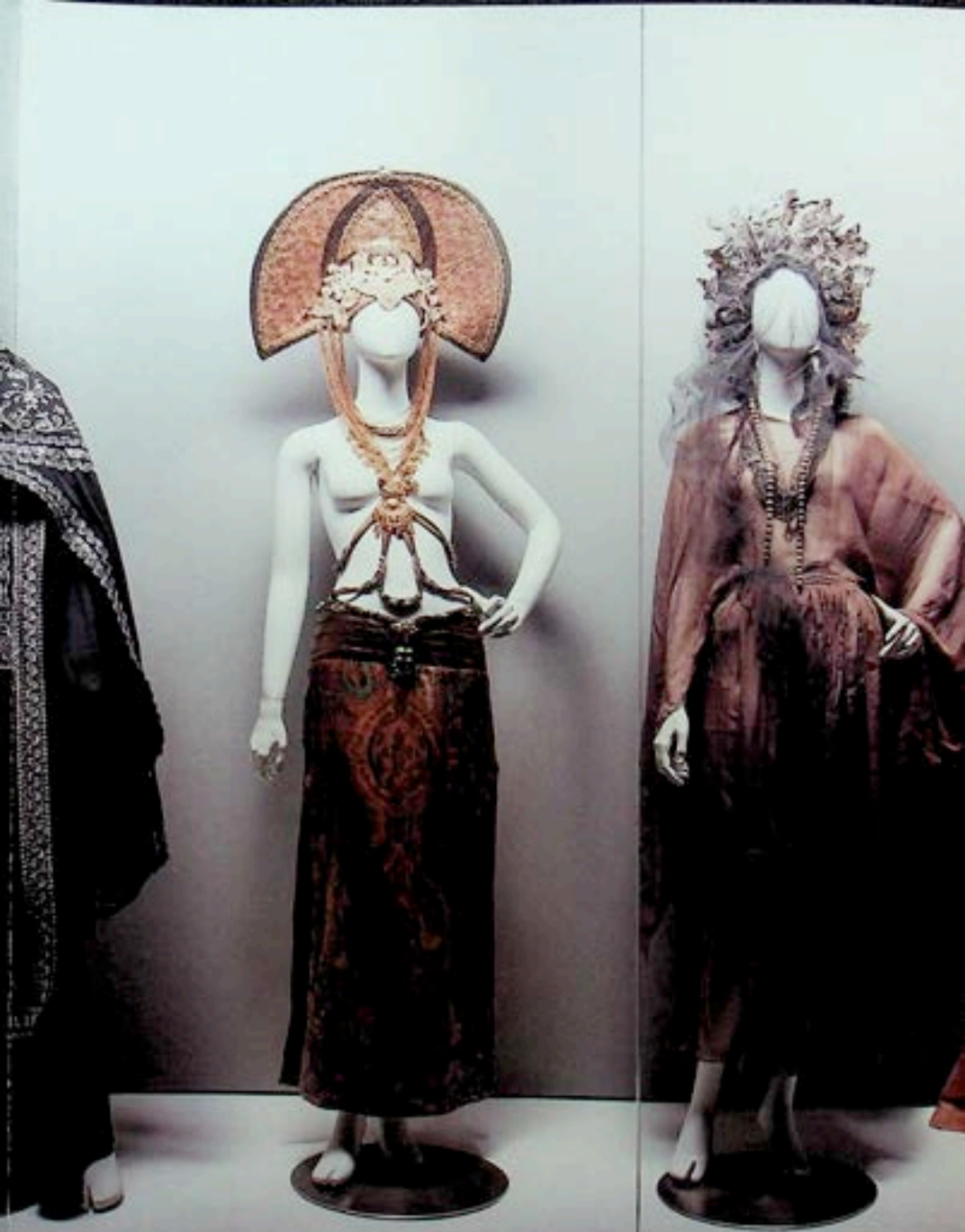
...w kostiumy: Andrzej Kredzi-Majewski | 2, 4, 5. „Kilgij Jahabaw”, Teatr Powstalczy w Warszawie, kostiumy: Katarzyna Białkowska | 16.