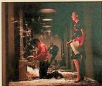
foto ze spektaklu The Cleansing of Constance Brown Matthias Friedrich

The Cleansing of Constance Brown – spektakl Teatru "Stan's Cafe" z Birmingham Po pierwszym pokazie – spotkanie artystów z widzami.