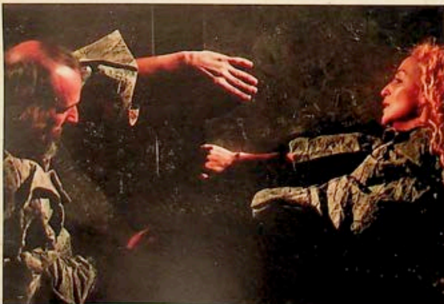
◀ MAKBET William Shakespeare, Makbet reżyseria i scenografia – Leszek Mądzik kostiumy – Zofia de'Ines muzyka – Andrzej Żarycki Teatr im. Juliusza Osterwy, Lublin premiery – 2010 r.