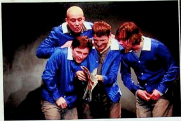
Tak wiele przeszliśmy, tak wiele przed nami Teatr Polski - Bielsko-Biała