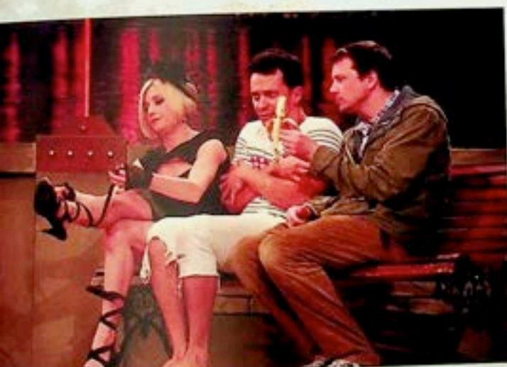
Się kochamy Ale! Teatr - Warszawa