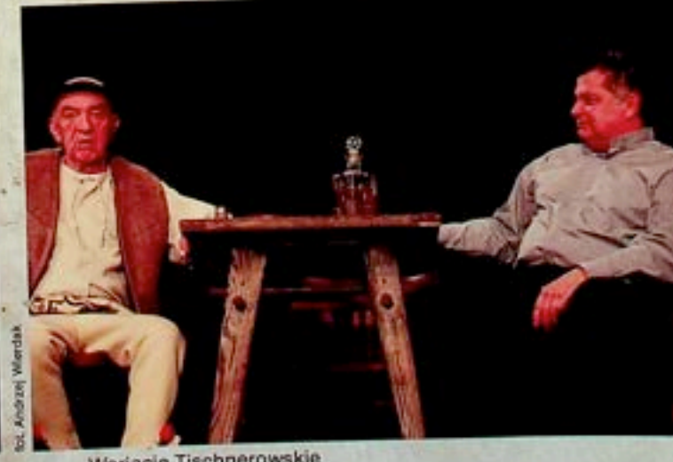
Wariacje Tischnerowskie Teatr STU - Kraków