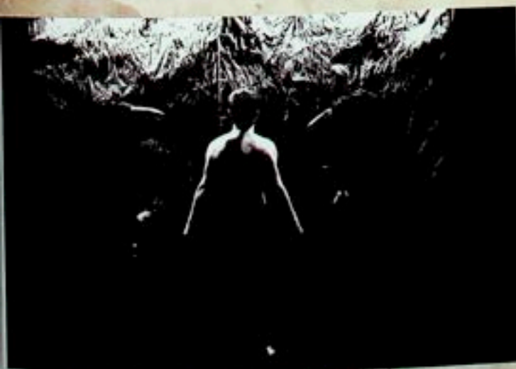
Lustro Scena Plastyczna KUL