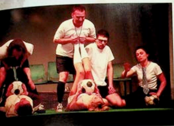
Być jak Kazimierz Deyna Teatr im. A. Mickiewicza - Częstochowa