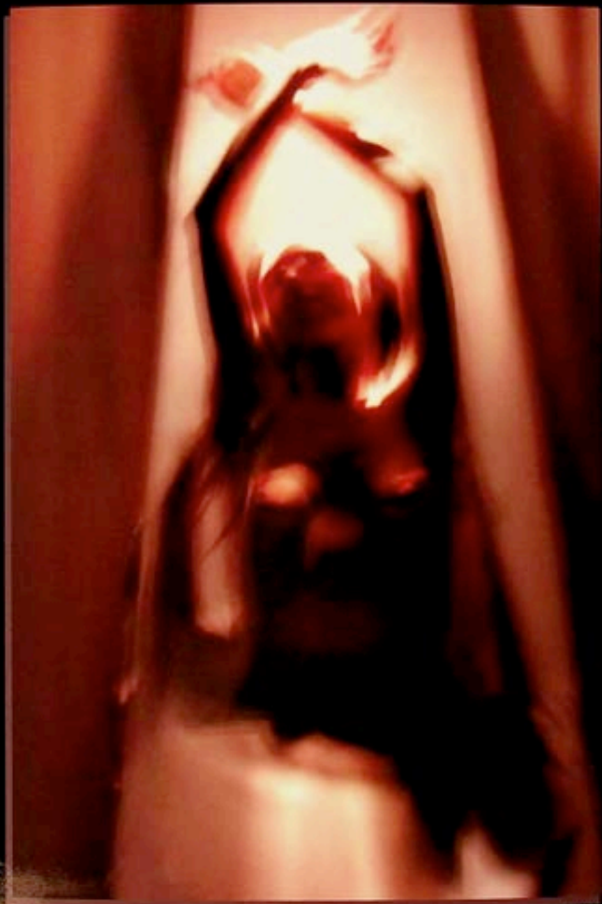
by Andrew Wyndol