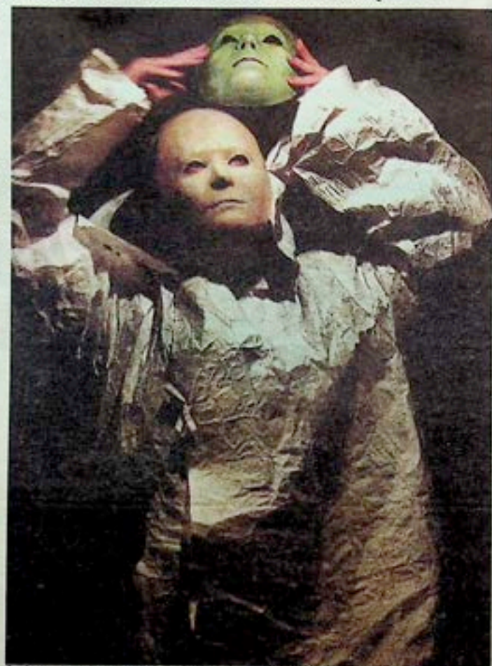
ŹRÓDŁO Spektakl zrobiony przez Mądzika we Wrocławskim Teatrze Lalek.

Dzisiaj godz. 17 na Dużej Scenie Wrocławskiego Teatru Lalek pokazane zostanie „Źródło”, wznowienie spektaklu w reżyserii Mądzika i z jego scenografią, zrealizowanego we Wrocławiu w 2005 r. Godzinę później w Sali Kolumnowej teatru odbędzie się wernisaż wystawy „Retrospektywa Sceny Plastycznej KUL”, prezentującej, jak to sformu-