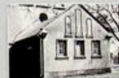
Wzdechówcu - kucielń, w którym zawał wzbierający Witold Gombrowicz