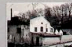
Doły Biskupie - hale fabryki tekstury