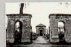
Dołach Biskupich - cmentarz z kaplicą Kotkowskich