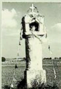
Kapliczka w okolicach Małazyc