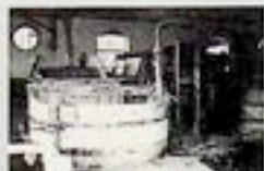
Dolny Biskupie - przędzalnica w fabryce włókien

... to był stały pejzaż mojej drogi z Kielc do Lublina. Ziemia Świętokrzyska po obu stronach pasma Wyżyny Kielecko - Sandomierskiej była mi bliską.