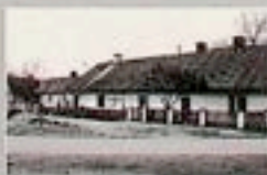
Dolny Biskupie - budynek maszyna obrabianych