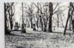
Wzdechówcu - cmentarz przykościelny