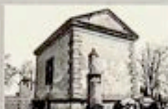
Denków - cmentarz z Kaplicą Kotkowskich