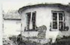
Dolny Biskupie - przędzalnica w fabryce włókien