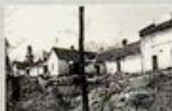
Dolny Biskupie - budynek fabryki włókien