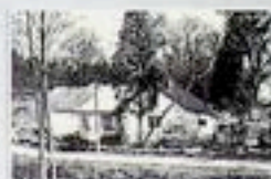
Doły Biskupie - młynkwa w fabryce wlny