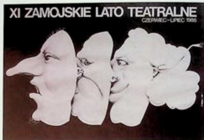
XI Zamojskie Lato Teatralne 1986 r. projekt Jakub Erol