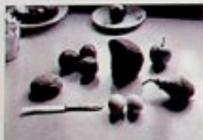
Jan Tarasin - "Fotografie"