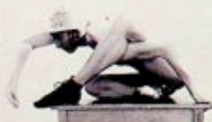
Jarosław Baranik - "Taniec współczesny"