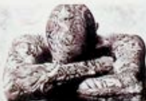
Tomek Sikora - Fotografie