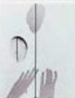
Muzeum Historii Fotografii ul. Józefitów 16