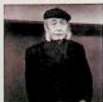
Hiroo Kikai - "Persona II"

Centrum Sztuki i Techniki Japońskiej Manggha ul. Konopnickiej 26