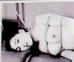
Nobuyoshi Araki - "Fotografie"