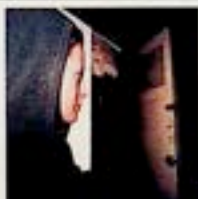
"wyTWARZanie odTWARZanie przeTWARZanie"