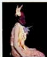
Galeria "Sito" ul. Łaska 1/4, 1 p.