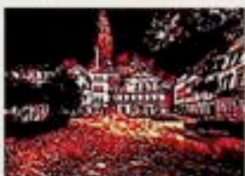
Andrzej Wierzechowski - "Zamek Alladyna"