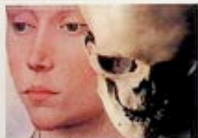
Leszek Mądzik - "Fotografie"