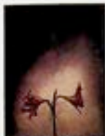
Andrzej Pilichowski-Ragno - "untitled"