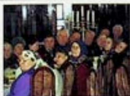
Muzeum Historyczne Miasta Krakowa Kamienica Hipolitów, Plac Mariacki 3

Wisław Majka – Fotografia Prasowa Ekspozycja jest prezentacją dorobku fotograficznego Wisława Majki i jest to reportaż z zapis jego pracy jako fotografa Użęzła m. Krakowa od 30.10 (wernisaż o 12h) do 30.11 (9 i 10.11 nieczynne) śr.-nd. 9-15h30 czw. 11-18h