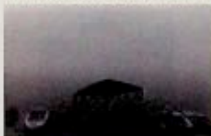
Anita Andrzejewska - "Fotografie"