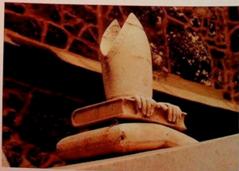
Tyr (Liban) - foto