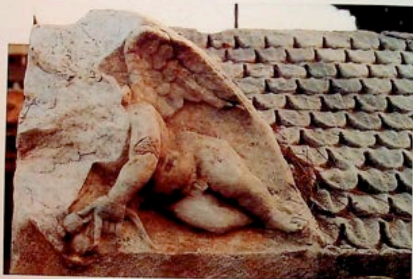
Brno - foto