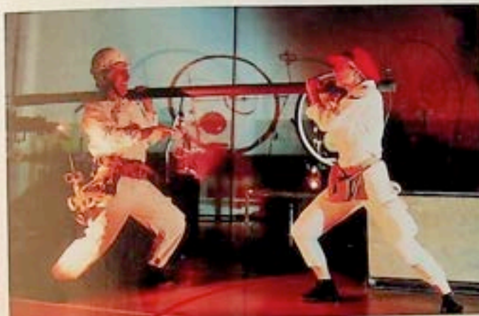
Theatre En Vol ORME

Spektakl wyrósł z refleksji nad przyszością przemysłowego świata, którego porządek opiera się na rabunkowej eksploatacji bogactw ziemi i ludzkiego wysił-