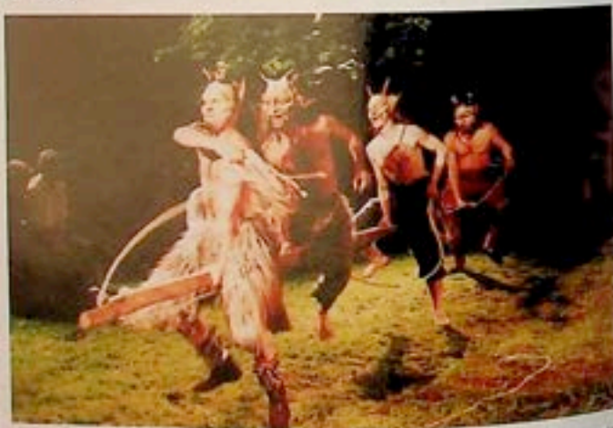
Ton und Kirschen Wandertheater