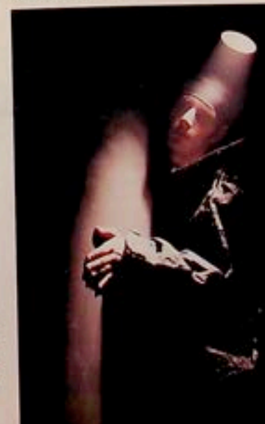
Scena Plastyczna KUL Kir

Ten, dobrze już znany w Poznaniu zespół, tym razem, podobnie jak poprzednio, zmierzy się z wielkim dziełem kultury europejskiej. Motyw i postać Doktora Fausta stanowiła inspiracją dla wielu twórców. Każdy z nich odnajdywał w Fauscie coś nowego i odmiennego. Dla jednych był on burmistrzkiem, dla innych poszukiwaczem. Ton und Kirschen Wandertheater postanowił całe to bogactwo motywów zebrać i wziąć za punkt wyjścia dla swojej pracy. Dzięki wspólnym improwizacjom powstało przedstawienie, które może być prezentowane zarówno młodym, jak i starym, mieszkańcom wielkich miast i małych wiosek. I jak we wszystkich poprzednich przedstawieniach, będzie w nim miejsce zarówno na chwilę zadumy, jak i moment uśmiechu.