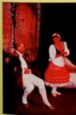
Teatr Kameralny, Tartufe czyli Obludnik