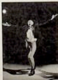
Teatr Derevo

Akademia Ruchu, założona w 1973 roku przez Wojciecha Krakowskiego, zrealizowała około 500 spektakli i akcji ulicznych w Polsce i poza jej granicami. „Piosenka przypomina samonapędzający się mechanizm, w którym w rytmie techno, jak w auto-