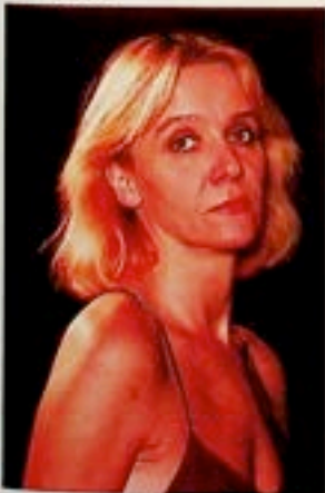
Teatr Ósmego Dnia