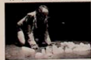
Teatr Daska

matycznej pracy, winią obrazy i zniechęca. Akademyści z przypadkowych na pozór, zaobserwowanych na ulicach gestów, destylują na scenie i dawają w nierównych porcjach czysty nonsens. Jednak w rzeczywistości dokonują swoistej psychoanalizy codzienności” (Paweł Gofliński, „Życie Warszawy”).