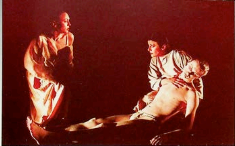
Teatr im. J. Osterwy