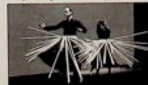
Teatr Akademia Ruchu

Spektakl Jerzego Jarockiego z Teatru Polskiego we Wrocławiu to zmysłowa opowieść o pewnej okolicy, w której „mężczyźni (...) nieciekawo, a kobiety cierpią na niespełnienie. Prokokujący, »filozofujący« wiejski nauczyciel, skandalizujący w słowach i czynach urasta do rangi bohatera, buntownika, człowieka wyzwolonego. (...) Dla rywali jest tym, który