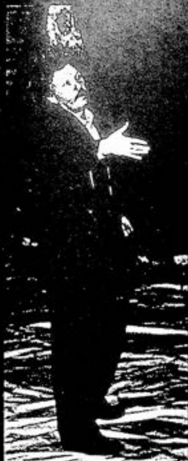
На корицата - "Скитник" - сценарий, сценография и режисура Лешек Монджик

ЛЕШЕК МОНДЖИК е режисьор и сценограф. Роден е на 5 февруари 1945 г. в Бартошовина в Свентокшиските планини. Занимава се със сценография от 1967 г. Основател и директор на театъра "Сцена пластика" към Католическия университет в Люблин.