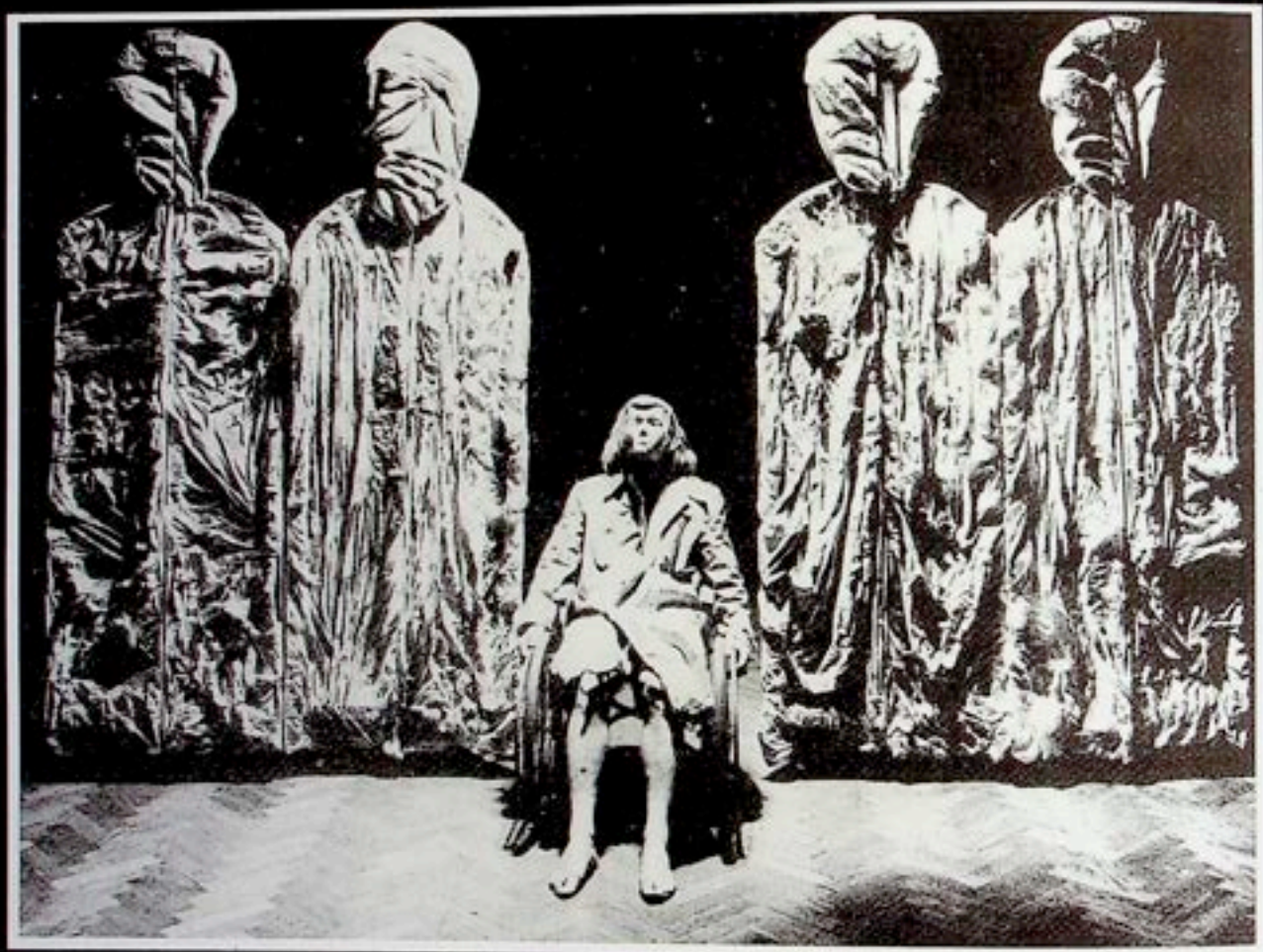
"Ikar" – scenariusz i reżyseria: Leszek Mądziak, muzyka: Stanisław Dąbek, dźwięk: Andrzej Mańka, światło: Sergiusz Roczkowski. Premiera – Freiburg – 24 kwietnia 1974, Lublin – 16 maja 1974.