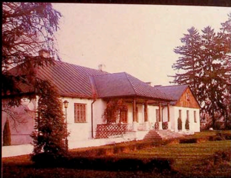
„Reymontówka” at Chlewiska

Editor: PIOTR ZIELIŃSKI