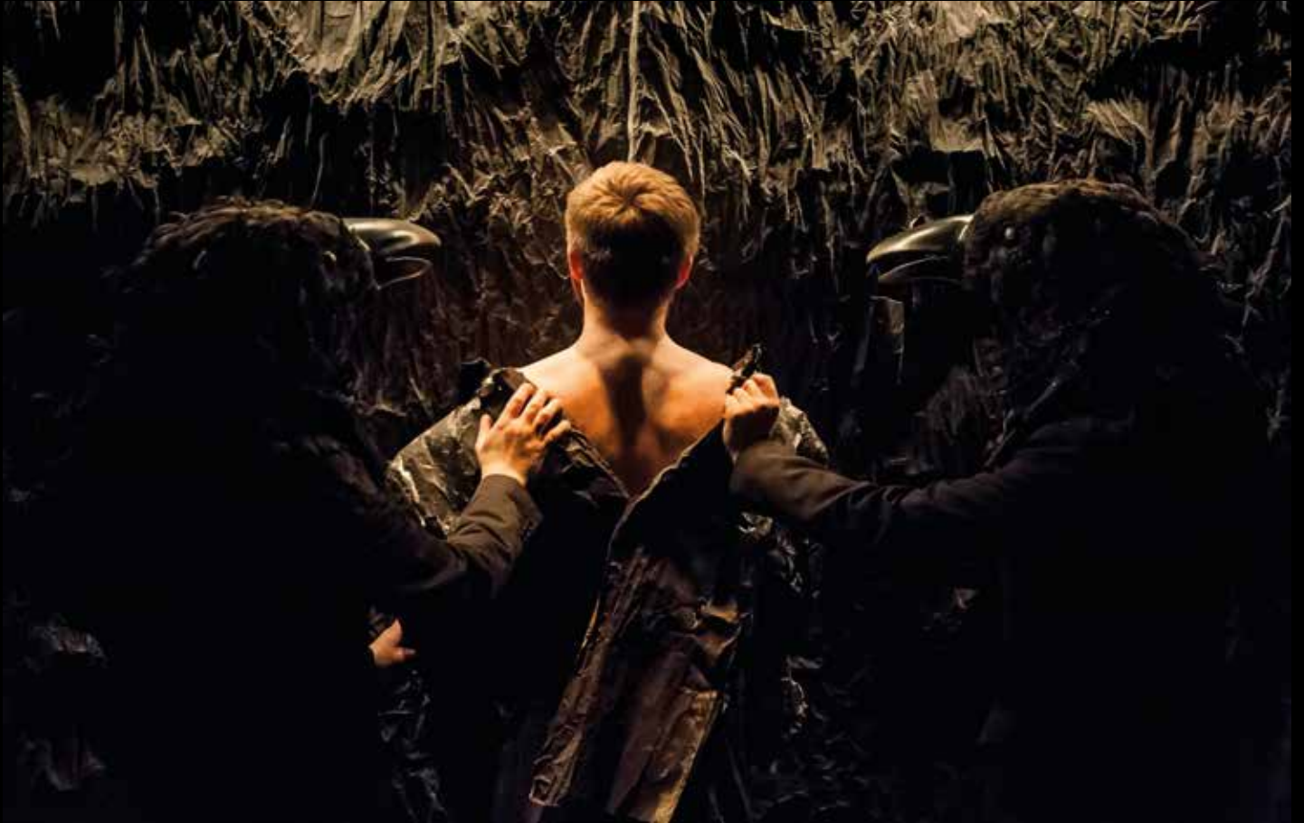
LUSTRO 2013