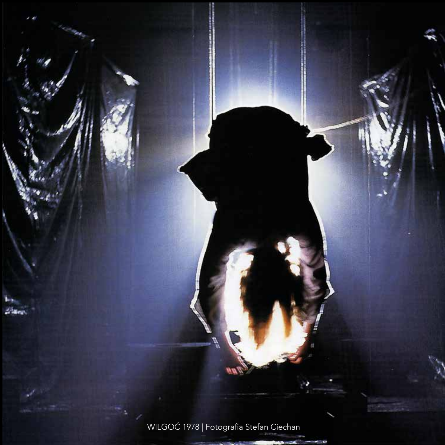
WILGOĆ 1978 | Fotografia Stefan Ciechan