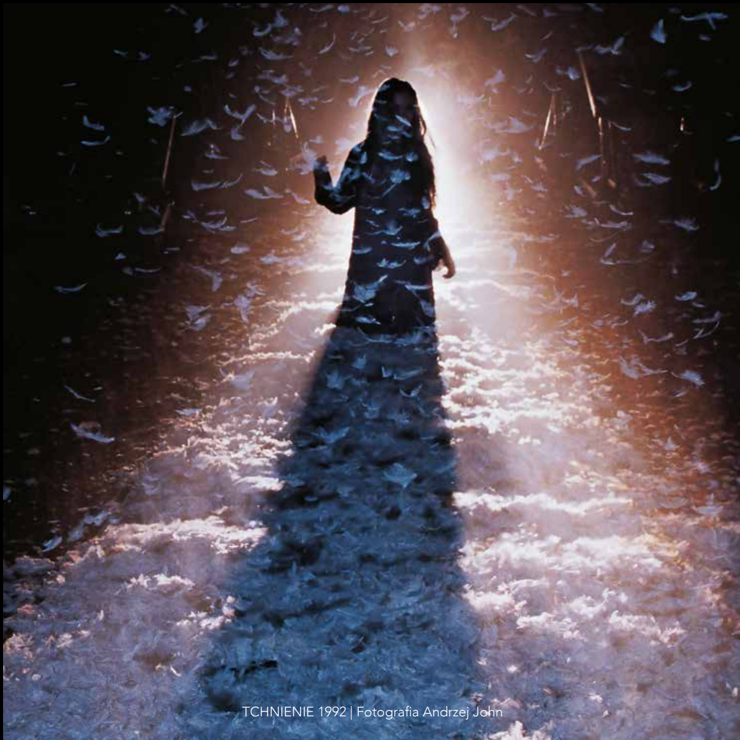
TCHNIENIE 1992