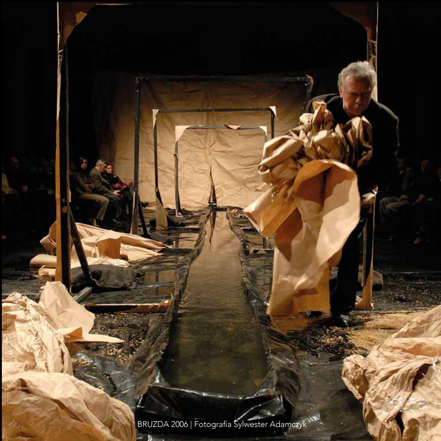
BRUZDA 2006