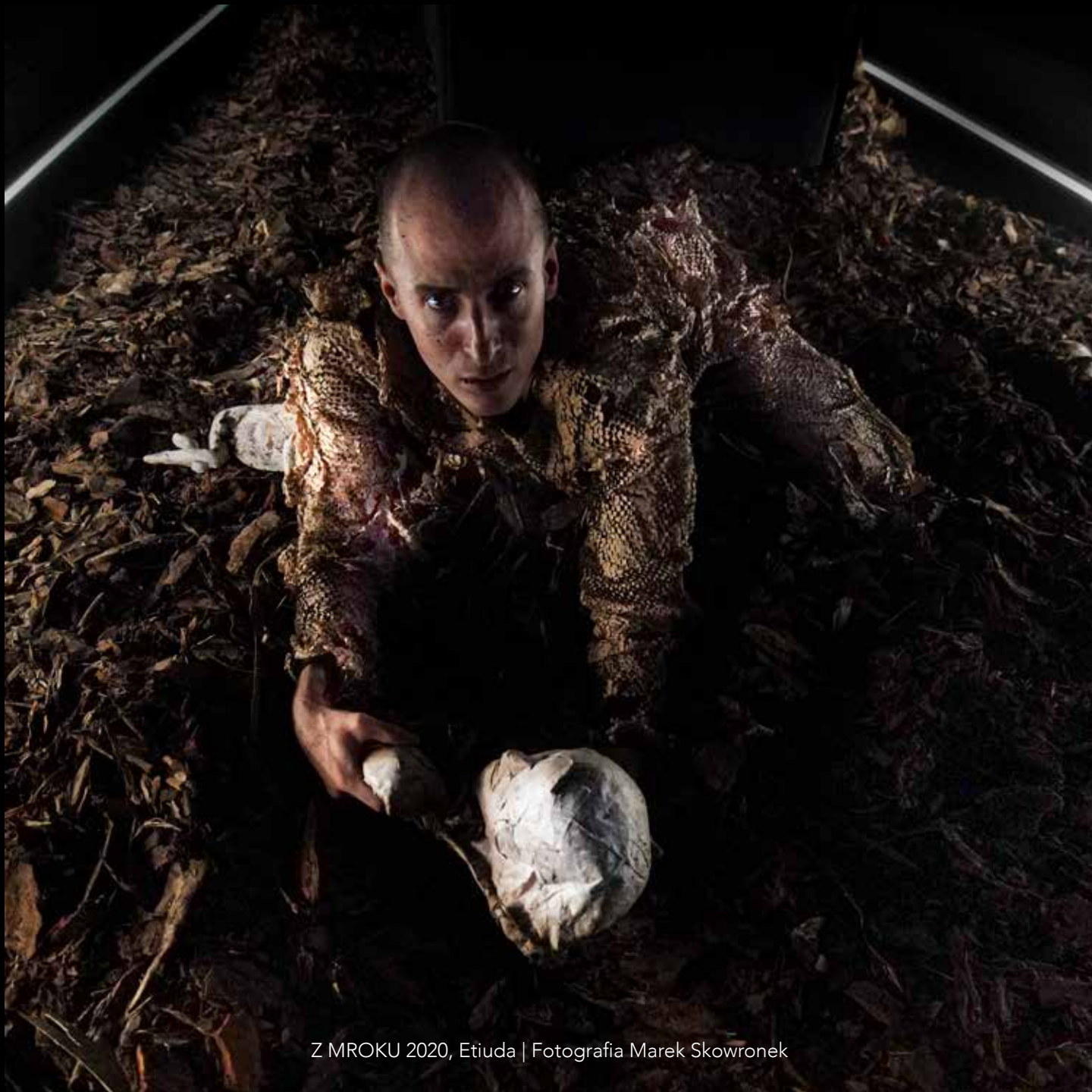
Z MROKU 2020, Etiuda | Fotografia Marek Skowronek